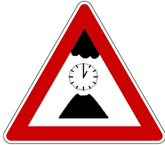
Sichtbehinderungen durch Vulkanausbruch mit Aschewolke täglich gegen 13 Uhr