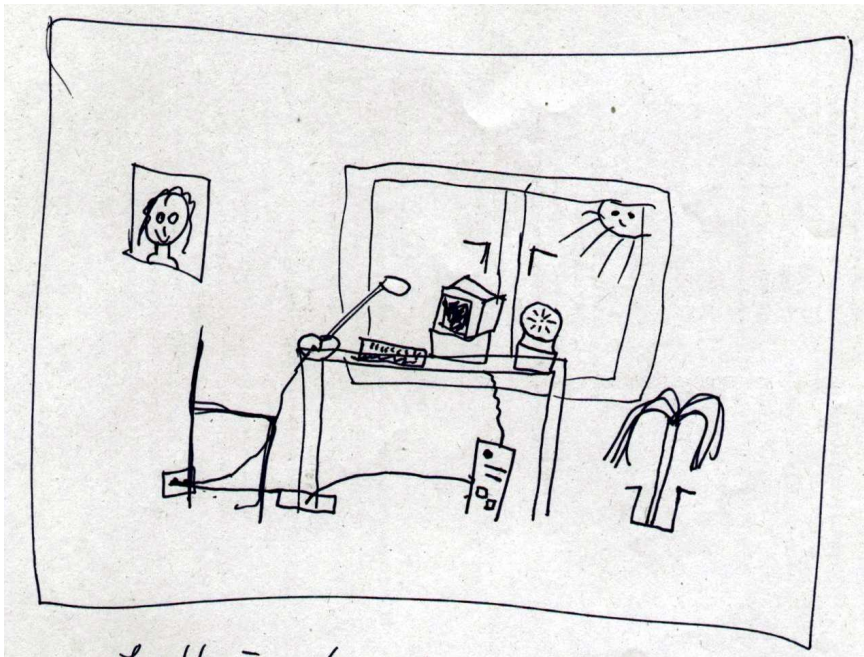
Goethe in absentia an seinem Schreibtisch (mit Yuccapalme), Stilo auf Recycling-Papier, ca 10 x 15 cm