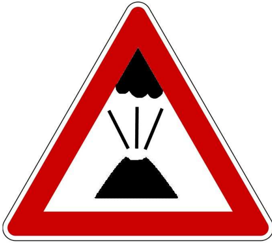
Sichtbehinderungen durch Vulkanausbruch mit Aschewolke