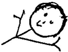
Oscar schaut von links herein